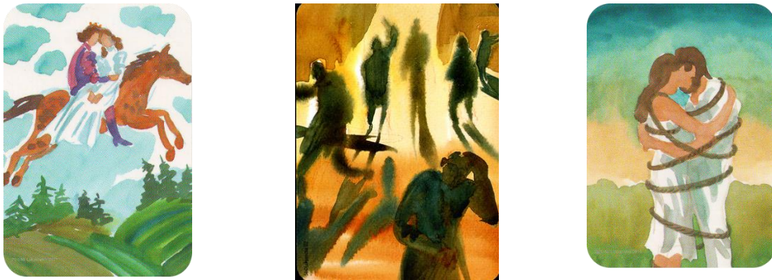
Рис. 3. Малюнок військовослужбовця А. де зображена історія його стосунків із дружиною

Під час консультації на прохання зобразити історію свого кохання – обрав наступні метафоричні картки (рис.3.).