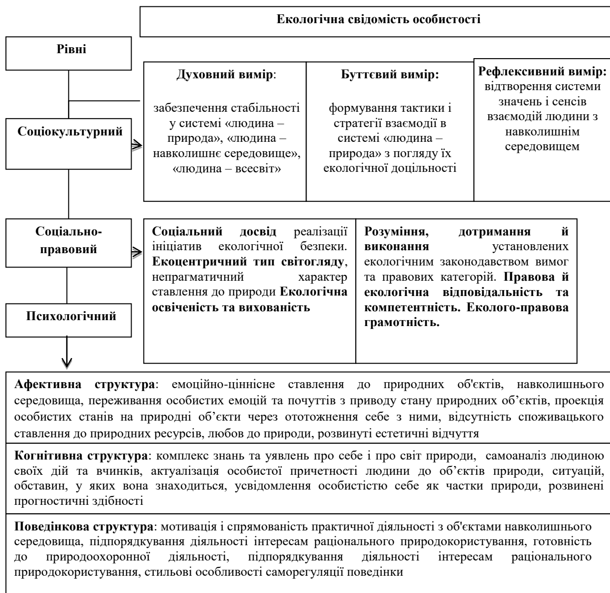
Рис. 1. Структура екологічної свідомості особистості

й саморозвитку особистості науковець уважав напругу, що виникає між біодинамічною та чуттєвою тканиною свідомості людини [9]. Роль значення і смислу в екологічній свідомості особистості досить повно висвітлено в дисертаційному дослідженні О. В. Білоусом [2].