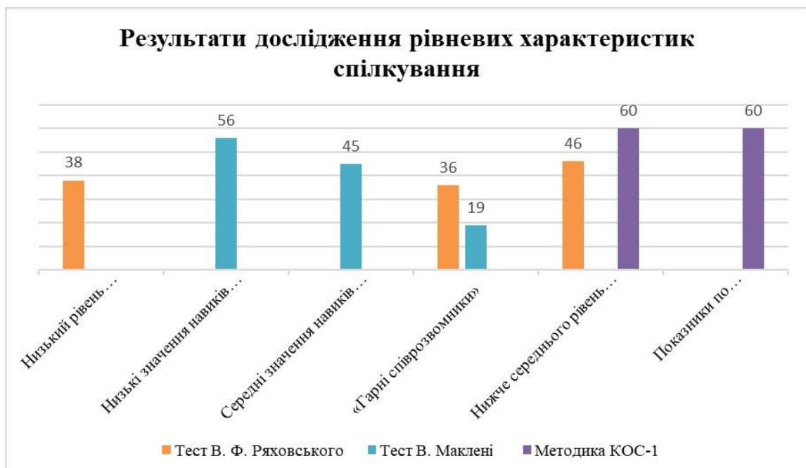
Рис. 1. Результати дослідження рівневих характеристик спілкування