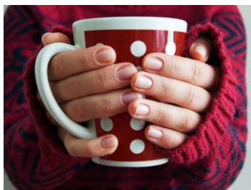
Рис. 3. Чашка