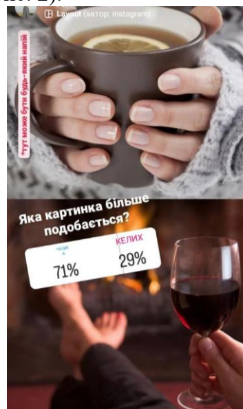
Рис. 2. Зображення керамічної чашки та скляного келиха (етап 1)

Дослідження проводилося у два етапи. На першому етапі респондентам було запропоновано два малюнки: зображення керамічної чашки та скляного келиха, завданням було обрати малюнок, який подобається більше. 71 % респондентів обрали зображення чашки, 29 % – скляного келиха (рис. 2).