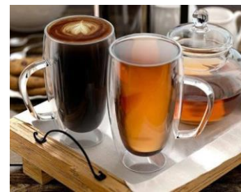
Рис. 5. Скляна чашка

Отже, отримані асоціації на чашку (рис. 3): тепло, радість, нові можливості, мрії; відчувається затишок, тепло; комфорт; тепло, затишок; затишок; тепло, затишок, сім'я; обійми, затишок, тепло, какао, приємні спогади, дитинство, солодкий, м'який смак; затишок, тепло, душевність; затишок, тепло, комфорт, спокій; створює відчуття затишку, домашня атмосфера, сім'я; тепло, затишок; тепло, затишок, спокій, атмосфера; дім, тепло, затишок; теплий чай – те, що треба взимку, і влітку, і будь-коли; тепло, спокій, приємна розмова, насолода, час ніби призупинився і стоїть на паузі; «у чашці може бути все, що завгодно»; передає почуття затишку, душевності, тепла; дім, тепло, затишок; тепло, затишок; затишок, тепло, спокій; тепло, затишок, спокій; тепло, затишок, релакс; тепло, затишок, ароматний чай; зігріває; «зараз зимно, а від фото з чашкою відчувається тепло»; «у чашці не видно, що налито. Хоч борщ. Келих – прозорий».